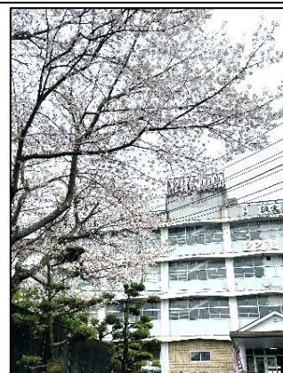
正門横の桜と校舎

今年度の学校便りのタイトルを「 夢実現 」としました。大矢野中学校の生徒には、夢や目標を掲げその実現に向けて主体的に努力する生徒になってほしいと思います。その「 夢実現 」に向けた生徒の頑張りや成長の様子を、季節の花々を添えて紹介してまいります。