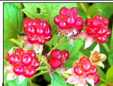
甘酸っぱい野イチゴの仲間