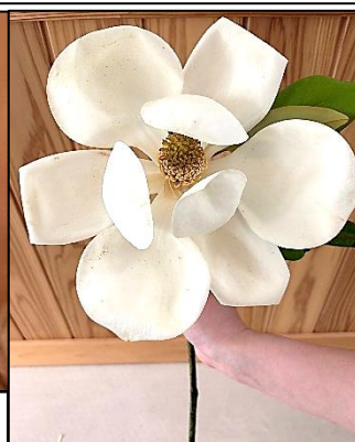
泰山木の大きな白い花