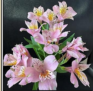
アルストロメリア