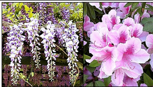
風に揺れる藤の花房