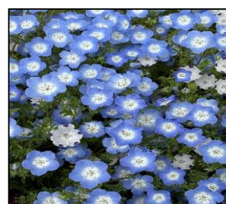
春日に輝くネモフィラ