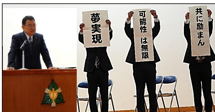
↑ テーマ発表の様子(3人の先生方にも協力いただきました)