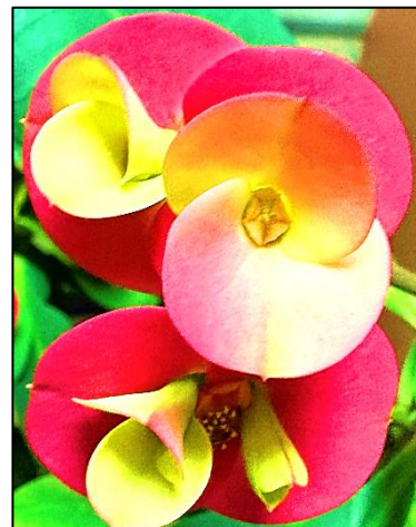
ハナキリン・シャインキス

冬休みには大きな事件事故もなく、無事に新学期を迎える事ができました。今年は、60年ぶりの丙午(ひのえうま)です。私は 午年(うまどし) の年男です。 馬のように、大きく、速く、力強く、飛躍の年に しましょう。良いことがたくさんありそうなワクワクとした気持ちで、 新年 を迎えています。