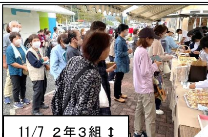
11/7 2年3組 ↓