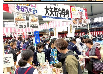
11/9 上天草バザール ↓

11/9（土）には、上天草高校の「上天草バザール」でも、販売させていただき、こちらでもたくさんのお客様に購入いただきました。これらの経験を生かし、自分の「夢」（将来・仕事）を見つけるため、その夢を「 実現 」させるため、 今やるべき事 に努力してほしいと思います。