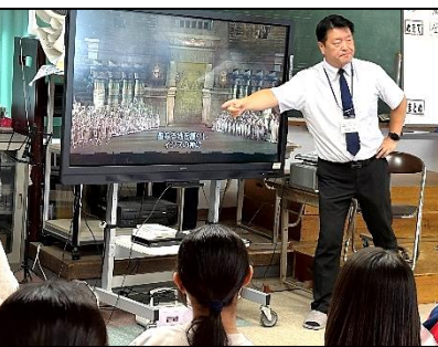
3年2組・音楽・後藤先生