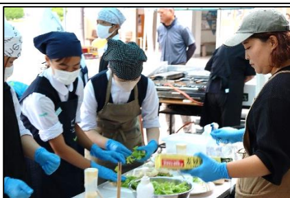
10/31 2年2組 ↓