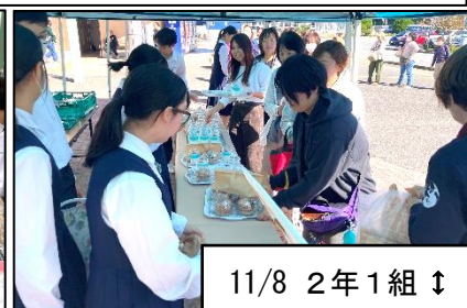
11/8 2年1組 ↓