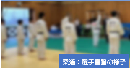
柔道：選手宣誓の様子