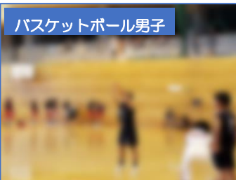
バスケットボール男子