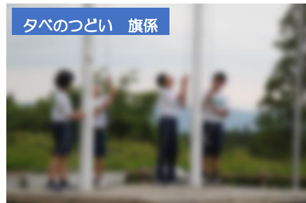
タベのつどい 旗係