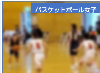
バスケットボール女子