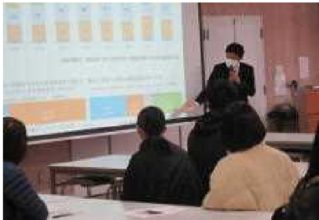
【阿蘇教育事務所木戸指導主事によるSNS活用安全講座】

今回は企画の段階から本校生徒会が6年生の疑問や不安を事前に確認した上で準備を進めてくれましたが、タブレットを用いて質問を配信し、意見を回収するという方法をとっており、時代の変化に対応している生徒の姿に頼もしさを感じた機会となりました。特に今回の説明会ではこの春から導入する第二制服(SDGs制服)の説明を丁寧に行う必要がありました。「ALL FOR THE NEXT ~すべては次世代のために~」という小国町の思いにも沿って作られた制服を、自信を持って説明する生徒会の姿に素敵な先輩として育ちつつあるなど、嬉しく思う時間でした。