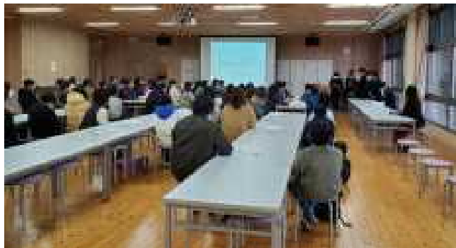
【多くの保護者の皆様方にお越しいただきました】