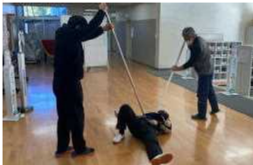
【不審者役は大変です】

訓練は、趣向を変えながらも、毎年の繰り返しです。その取組の中に、課題を見つけ、対応マニュアルの改善を図る。次は火災避難訓練です