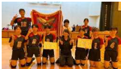
【阿蘇郡市新人中学生大会】

しました。バレーボール部は南小国中学校との合同チームであり、練習時間の制約など、活動をする上で様々な難しさを抱えています。また、チーム全員がベストの体調とは言えない状況での今回の結果は、日頃の地道な練習を積み上げてきたからこそその成果だと言えます。この大会の結果を受けて、次は県大会に阿蘇郡市代表として出場します。まずは体調を整えて、自分たちがどこまでいけるのか、存分に挑むのみです。