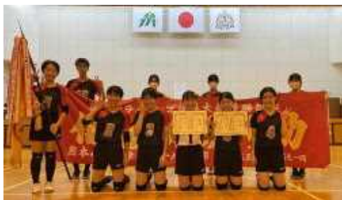
【阿蘇郡市協会長旗大会】

9月23日に阿蘇郡市協会長旗バレーボール大会、11月3日に阿蘇郡市新人中学生バレーボール大会が開催され、両大会において本校バレーボール部が優勝