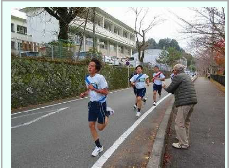
地域の声援も力になりました

結果はここには書きません。各学級が一つになって襷(たすき)をつなぐ姿が一番です。