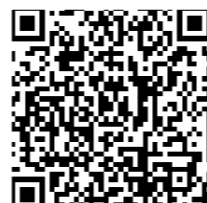
県いじめ防止基本方針 いじめ防止等リーフレット (熊本県教育委員会HP)

(問い合わせ)熊本県教育庁 県立学校教育局 学校安全・安心推進課 TEL:096-333-2720 Mail:gakkouanzen@pref.kumamoto.lg.jp