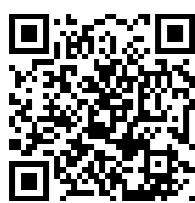
生徒指導リーフ (国立教育政策研究所)