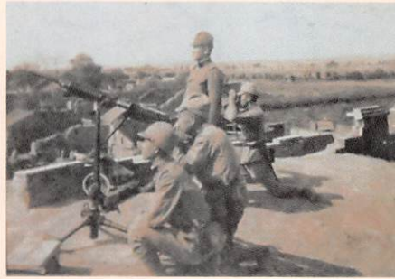
日中戦争関係写真