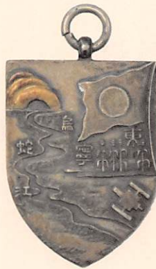
陣地守備記念記章