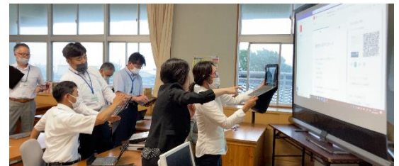
くまもとGIGAスクールプロジェクト中心校の教職員研修の様子（苓北町立富岡小学校）

＜優良校認定されました！＞ R3.5.12 水上村立岩野小学校 R3.5.27 荒尾市立桜山小学校