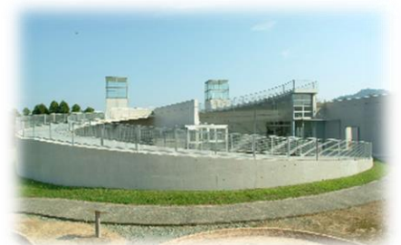
建物は建築家の安藤忠雄氏による設計（くまもとアートポリス作品のひとつ）