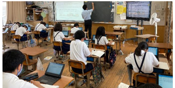
くまもとGIGAスクールプロジェクト中心校の児童の活用の様子（苓北町立苓北西部小学校）