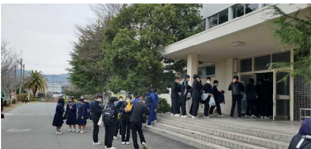
玉名工業入試会場の様子

3/9・10は公立高校後期選抜入試が行われました。本校からは熊本市内公立高校を含め24名が挑戦しました。倍率の高い高校を受験した生徒もいます。この日のために学校や塾等で勉強に専念したかと思えます。全員合格を祈っています。