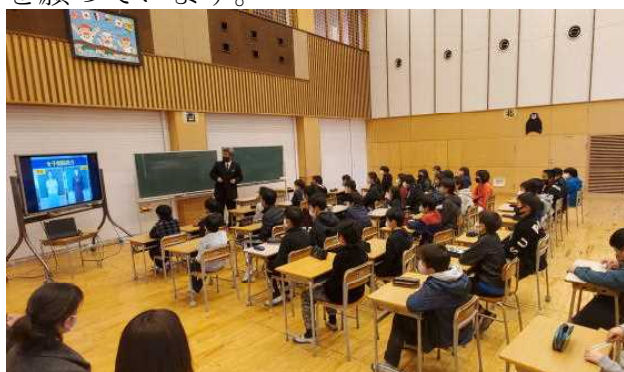
真剣に話を聞く長洲小学校の6年生

2月に実施した新入生体験入学が保護者のみの参加でしたので、3/3・4に長洲小学校、清里小学校を訪問し、入学前の6年生に心構えを含めて中学校の説明を行いました。子どもたちは目を輝かせて真剣に話を聞き、部活動や勉強のことでの質問をしてくれました。今のところ、令和3年度の長洲中学校への入学予定者は50名となっています。中学校入学への不安が少しでも解消され、元気に入学式に来てくれることを願っています。