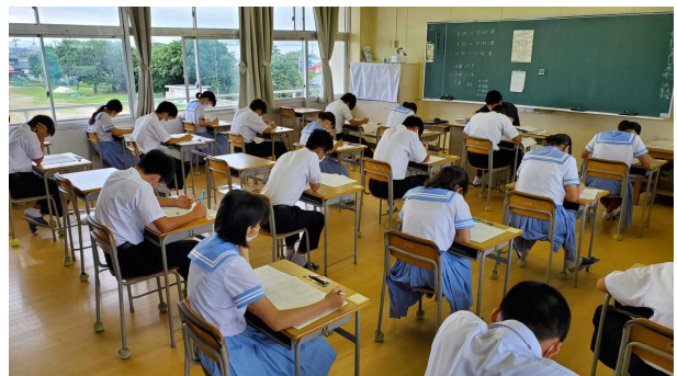
真剣な表情でテストに取り組む3年生

7/15、16に3年生は実力テストを行いました。今後、このテスト結果を参考に進路指導等が行われます。テスト結果が返却され、思うような点数がとれなかった人も多いかと思います。定期テストとは違い出題範囲が広く、短期間の勉強では対応できません。長期的で地道な積み重ねが大切です。間違いをしっかりと訂正し、間違えた箇所を理解できるようにしてください。自分の勉強方法の見直しも必要です。頑張れ! 3年生!