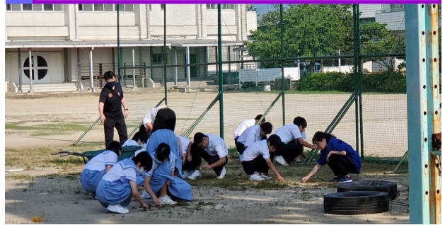
朝のボランティアの様子

グラウンドの周辺の草が目立ってきました。そこで、ボランティア委員会の提案で、朝、クラスごとに除草作業をすることになりました。天気の良い日は、始業前に除草作業する生徒の姿が見られました。最近、雨の日が多く予定どおり作業が進みませんがとても助かっています。