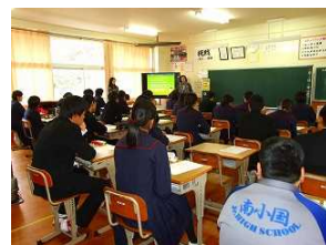
ストレスマネジメント