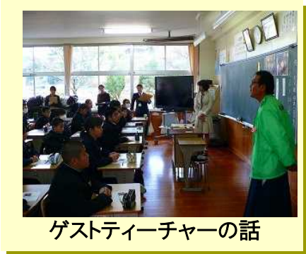
ゲストティーチャーの話

1年生は、ゲストティーチャーからのお話を直に聞きながらの授業でした。吉原神楽を伝承する方々の思いと自分を重ね合わせて、郷土を愛する心を育もうとする授業でした。