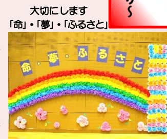
大切にします「命・夢・ふるさと」

「自ら学ぶ」ことは必要です。また、その選択肢は無制限の可能性を秘めています。ですから、今年度「夢や目標」を大切に生きていくためには「自ら学ぶ」ことが必要です。また、その選択肢は無制限の可能性を秘めています。ですから、今年度「夢や目標」を大切に生きていくためには「自ら学ぶ」ことが必要です。また、その選択肢は無制限の可能性を秘めています。ですから、今年度「夢や目標」を大切に生きていくためには「自ら学ぶ」ことが必要です。