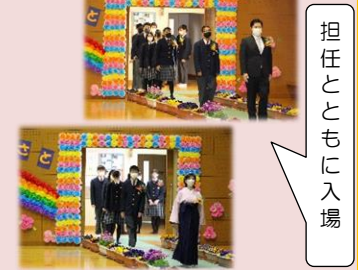
「Man makes himself.」担任とともに入場

した。感染症対策のため本年度も来賓及び在校生が参加できない、歌声が響かない中での式となりましたが、卒業生の堂々とした姿から厳かで温かい式になったのではないかと思います。