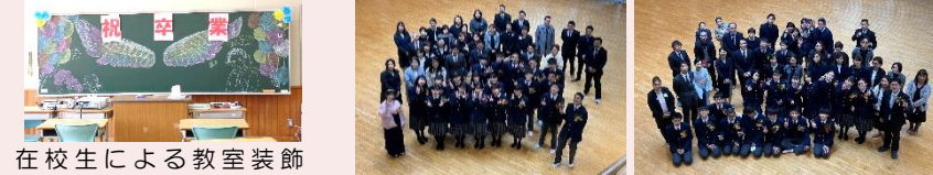
在校生による教室装飾