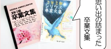
思い出の詰まった卒業文集