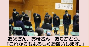
お父さん、お母さん ありがとう。「これからよろしくお願いします。」

（人間だけは自分で自分をつくることができる）という言葉を贈りました。これは、他の動物が自然に成長していくのに対し、人間が人間になるためにはいろいろなことを学んで身につけていかなければならないけれど、何を学んで自分のものにするかは、個人の判断に任されているということの意味します。学ぶべきものは、人間が長い時間をかけて作り出し、蓄えられたもので、どういふものを選び、自分のものにするかによってそれぞれ違った生き方をする人間になるといえます。