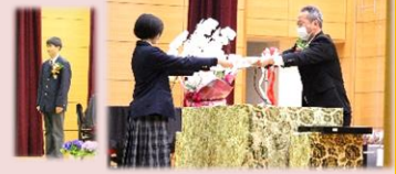
返事 卒業証書授与