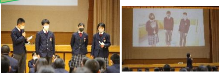
各委員会の仕事を、工夫を凝らして伝えています