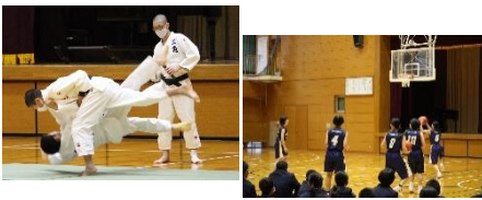
各部とも実演を交えてアピールしました！