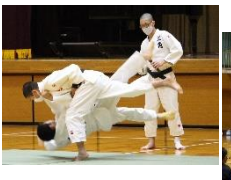
各部とも実演を交えてアピールしました！

しかし、全国からの温かい支援を受け「命があれば何とかなる」とも思いました。子どもたちの命を大切に作る学校を目指します。 二つ目は「夢」です。夢を実現することも大切ですが、それまでの努力する過程がもっと大切だと思えます。夢や目標に向かって努力する生徒を全力で手助けする学校を目指します。 三つめは「ふるさと」です。家族、学校、友達を含む「ふるさと」は将来生きていく上での基