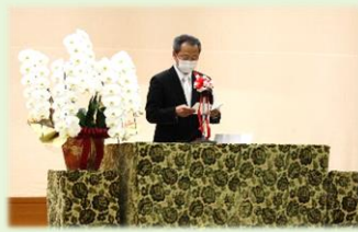
学校長式辞のようす

盤となりえます。地域のことをしっかりと学び、元気なあいさつをしたり、活躍したりすることで地域を元気にするような子どもたちを育てます。 この三つをキーワードに子どもたちと共に頑張ってください。どうぞ御理解と御協力をお願いいたします。