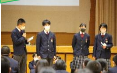
各委員会の仕事を、工夫を凝らして伝えています