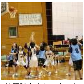
練習試合を行いました

さて今年度は、宇城中体連大会は中止となりましたが、三年生にとって部活動で頑張ってきたことの集大成として代替大会が行われることとなりました。