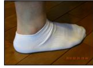
くるぶしが見えるもの ○