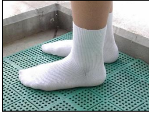
白または黒の靴下 ○