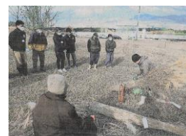
(カヤ刈り普及の説明会)

記事は職員室前に貼っていますが、これを見ると「現実の厳しさに負けずに頑張らないといけない」という思いになり、地元ですばらしい方がたくさんいらっしゃるのことが分かります。皆さんの身近に関係者がいらっしゃるかも知れません。冬休みは、家族・地域の人たちからいろんなことを学んでください。