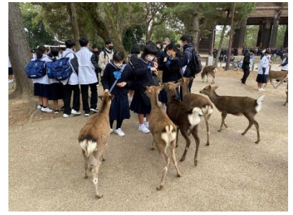
鹿に好かれていますねえ。