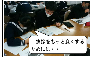
挨拶をもっと良くするためには・・・

生徒会役員が活動がいよいよ本格的にスタートしました。冬休みに実施したリーダー研修の中で、令和2年の「成果指標」について振り返り、改善すべき項目と改善策について分析を行いました。また、その改善策も踏まえて、3学期の委員会活動やスローガンについても考えていきました。これから、リーダーとしての資質をどんどん高め、御船中を改革してくれると期待します。