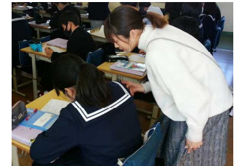
課題で分からなかったところを、朝から先生に教えてもらっています。

県学力・学習状況調査を12月4日に実施しました。この調査は県内の小中学生を対象に県下一斉で行われ、学力や学習の状況を分析して、次の学力向上へとつなげる目的があります。例年、この調査を実施していますが、学習の定着率が県平均を超えることが難しいのが現状です。