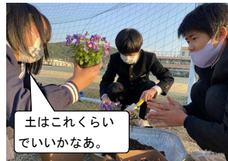
土はこれくらいでいいかなあ。

11月から、環境美化委員会の生徒を中心に、校内外に花を植えたり、飾ったりしています。生徒自ら、花壇やポットの土をおこし、花を植えました。また、当番で水やりをしています。校外では、シンボルロード沿いのフェンスに花を飾りました。地域の方からも「きれいですね。」「心が和みます。」と声をかけていただきました。地域の環境づくりに少し貢献できた気持ちです。大切に育てます。