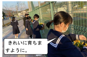
きれいに育ちますように。

自分で初めて、花を植えて飾りました。土は冷んやりしていましたが、花を見ると暖かくなりました。きれいに育てていきたいです。(環境美化委員会2年生女子)