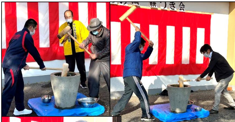
↑地域の方やお年寄り、生徒も先生方もみんなで一緒に餅つきをしました。