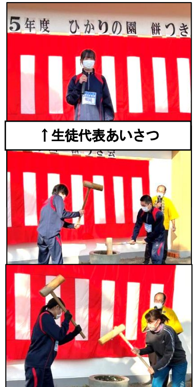
↑生徒代表あいさつ