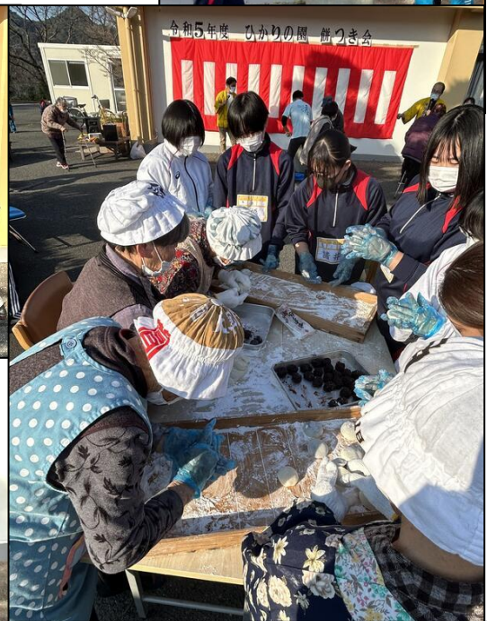
↑通所の方々と一緒に餅をこねました。