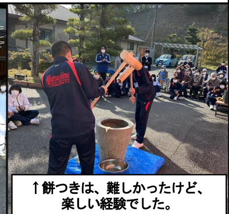
↑餅つきは、難しかったけど、楽しい経験でした。