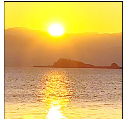
阿村の干切漁港付近から 臨む2024年初日の出

皆さんは、どのような気持ちで新年を迎えましたか。家族とゆっくり過ごししながら、新年の 抱負 や 目標 を持つことができましたでしょうか。皆さんにとって、目標に向けて頑張れる年、目標が達成できる 良い年 になるよう祈ります。