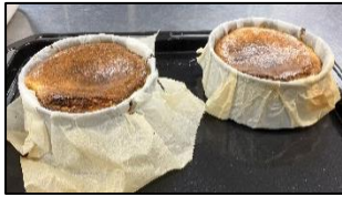
天草大王の卵を使った バスクチーズケーキ