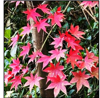
かろうじて残っていた秋紅葉（もみじ）

まだまだインフルエンザの生徒もおります。体調管理をしながら、早足で移りゆく季節を楽しみたいものです。