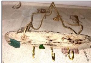
流木で作った アクセサリ小物