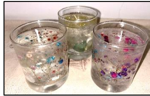
上天草の特産品を使った アロマキャンドル