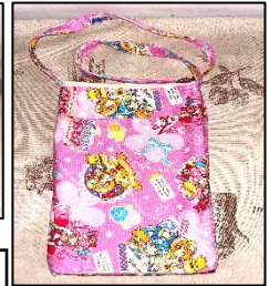
古着で作った サコッシュ