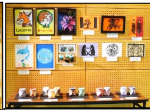
特別支援学級の作品