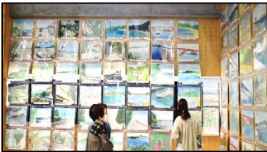
美術：描画・風景画

展示 ：力作が並び、レベルの高い秀作には、生徒や保護者からも感嘆の声が聞かれました。郡市文化展(11/1~11/5 教育会館)への出品や、上天草バザール(11/11 アロマ)での販売もあります。