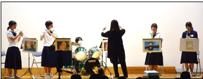
吹奏楽部 ：引退した3年生の力も借り、6人で堂々と「人生のメリーゴーランド」の曲を演奏しました。

ステージ発表 ：趣向を凝らした演出と、一生懸命な発表の姿がたくさん見られました。