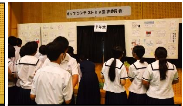
ポップコンテストの様子