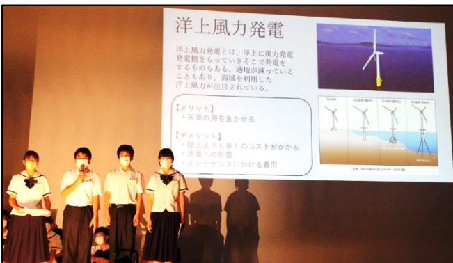
1年総合 ：「未来の天草・松島」のために、調査を基にした課題解決のアイデアを提案しました。