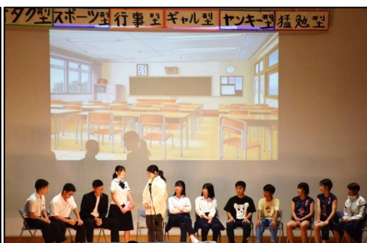
3年劇 ：進路選択の岐路に立つ中学3年生の苦悩を描いた「マイライフ」。等身大の熱のこもった演技と、裏方まで3年生全員で作り上げた舞台は、感動を呼びました。