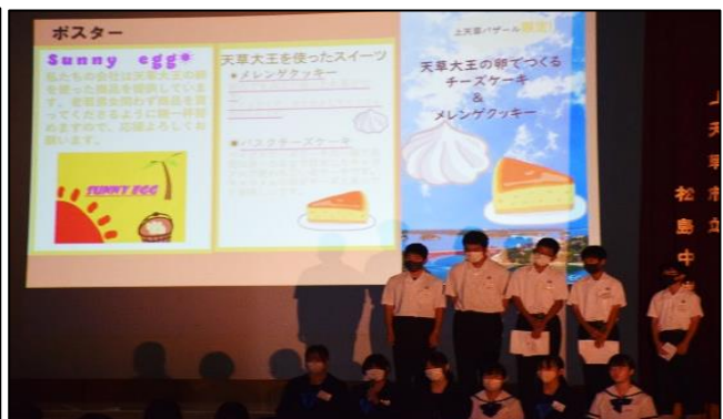
2年総合 ：地元の方々の協力も得て、地元の魅力を発信する起業アイデアと商品開発を発表しました。