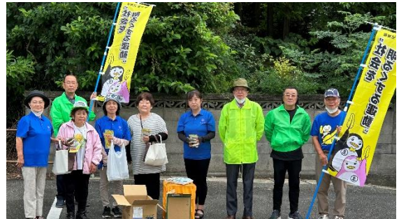
天草地区保護司会上天草分会の皆さん