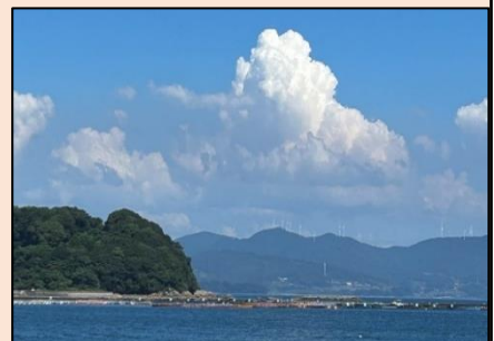
はえ 南風受けて 雲と憧れ 上りゆく