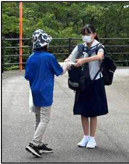
← 挨拶運動の様子 ↓

朝からとても微笑ましい光景でした。改めて地域の方々の見守りのおかげで、子どもたちは素直に成長しているのだと感じました。