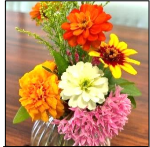
マリーゴールド、 ジニア、ペンタス

体育大会、集団宿泊、生徒会活動、部活動等の大会、ボランティア活動、そして、中体連。生徒会テーマ「 自主・自律 」のもと、主体的に3年生がリーダーシップを発揮し、全校生徒がまとまってその活動に精一杯取り組み、その成果が出ていたように思います。夏休みも2学期も期待せずにはられません。