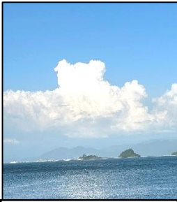
不知火海 越えて そびゆる 入道雲

この学校便りでもお知らせしてきましたように、 生徒の活躍 が光った 1学期 でした。