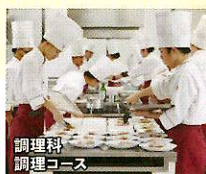
調理科 調理コース