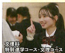
文理科 特別進学コース 文理コース