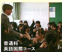
普通科 英語国際コース