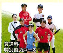
普通科 特別能力コース