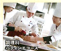
調理科 パティシエコース