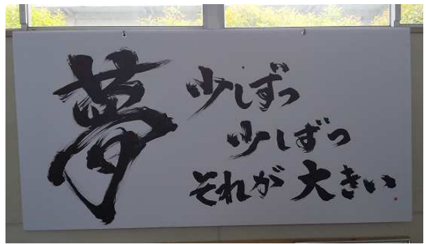
＜職員室前階段に掲示＞

この力が根となり、様々な能力を開花させていくと考えます。 生徒も同様。お子さんのその力を認めほめてあげてください。