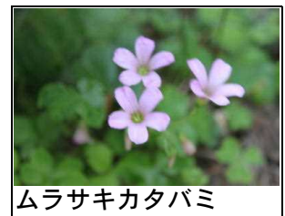
ムラサキカタバミ