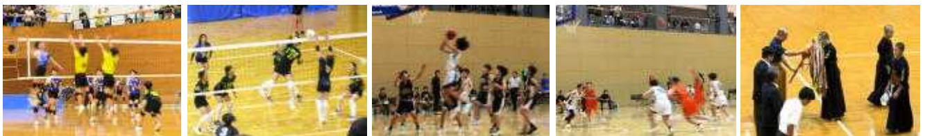
男子バレーボール部 準優勝

6月27日（土）、28日（日）にバレーボール、バスケットボール、剣道競技の郡市中体連が開催されました。気迫のこもった素晴らしいプレイで、各会場に“合志の旋風”が吹き荒れました！！