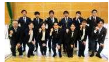
【新任・転入の先生方】

▼暖かな春の陽射しが降り注ぐ穏やかな季節となりました。保護者の皆様、地域の皆様におかれましては、益々ご健勝のこととお喜び申し上げます。▼いよいよ、令和8年度がスタートしました。「自律・協働・貢献」のスローガンのもと、これまで以上に充実した教育活動を行っていきたいと考えています。▼260名の新入生を合わせた778名の全校生徒と61名の先生方で、さらに伸びゆく合志中になるよう頑張ります。どうぞよろしくお願いいたします。