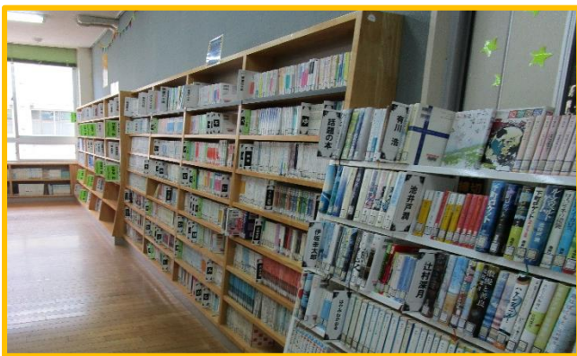
【2. 3年生は今までの違いがわかるかな？】

新型コロナウイルス感染症対策のため4月の始業式から図書室を閉館していたため、1年生は図書室の雰囲気もわからないままの5月突入となってしまいますね。そして5月7日以降の図書室利用も状況に応じて変更の可能性もあります。そこで今回は少しか図書室の様子をお便りでお届けします♪