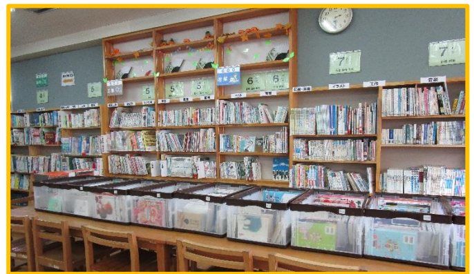
【学級文庫も出番を待っています】