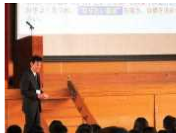
どうぞよろしくお祈りします。

うららかな春の光の中、色とりどりの花が咲き誇る季節を迎え、まじらした。保護者の皆様、地域の皆様、よろしくお祈りします。うららかな春の光の中、色とりどりの花が咲き誇る季節を迎え、まじらした。保護者の皆様、地域の皆様、よろしくお祈りします。