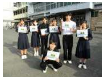
【生徒会執行部の皆さん】

まさしく、「自律貢献」です。人のために、動ける合志中生は素敵です！赴任早々、嬉しくて、通信に掲載しました。