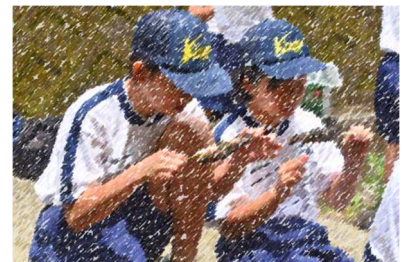
【ニジマスの「命」をいただいている様子】

私が頑張ったことは、移動の時にみんなとおしゃべりをしないということ頑張りました。学んだことは、命の大切さです。ニジマスつかみの時にかわいそうだと思います、このまま逃がそうとしたけど、一つの命を無駄にするといい、食べる前に「いただきます」、食べ終わってから「ごちそうさまでした」と心を込めていました。このとき「命」をいただくというのはこういうことなのだなと思いました。これからは食事の時には、心を込めてあいさつをしようと思いました。