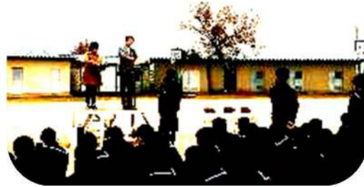
男子バスケットボール上益城郡選手権大会 2位 女子バスケットボール上益城郡選手権大会 3位

いよいよ中体連まで約6ヵ月となりました。各部活動のさらなる活躍を期待しています。