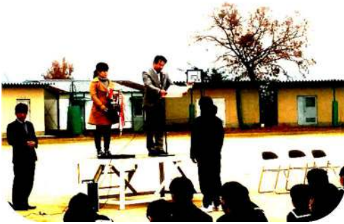
県教職員蹴友会会長旗サッカー大会 優勝

寒い中、各部活動は日々の練習に励み、努力を継続しています。練習の成果も実り、それぞれがしっかりと力をつけてきています。各大会で入賞した部活動もありますので、紹介します。