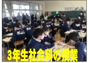
3年生社会科の授業

二月十四日、今年度最後の授業参観とPTA総会・学級懇談会を実施しました。たくさんさんの保護者の皆様に参観していただき感謝します。 一年生は進路学習として、ハローワーク玉名から講師をお招きし、「将来へ向けて中学生で身に付けておきたいこと」と題して講話をしていただきました。 二年生は立志式を行い、生徒一人ひとりが立志の誓いを発表しました。三月十四日には、立志式パート2として、日本航空熊本支店から講師をお招きし、職業講演会を実施します。 三年生は社会科の授業で公民の学習でした。 PTA総会では来年度の本部役員が昇任され、新しい組織作りが進みました。六年度役員の方々に大変お世話になりました。