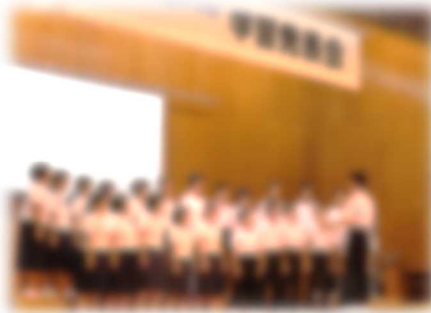
[2年生ステージ発表]