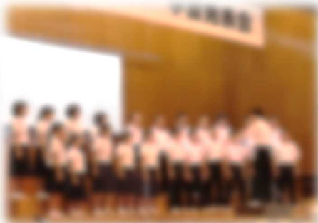
[1年生ステージ発表]