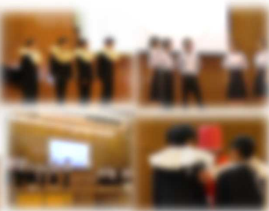
[3年生ステージ発表]