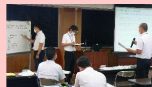
玉名管内での研修の一場面

○今回学んだことを基に、町内の小中学校で方向性を揃えて、小中学校のつながりがある教育活動を進めていきたいと思っています。