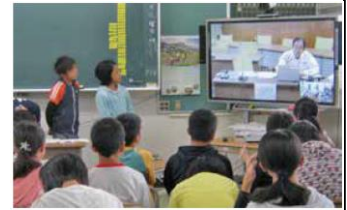
小6「理科」 JAXAの研究者とテレビ会議を実施し、星や天体への興味を高めた

御家庭でも、「学ぶことのすばらしさ、楽しさ」を子供たちに伝えていただきますようお願いします。