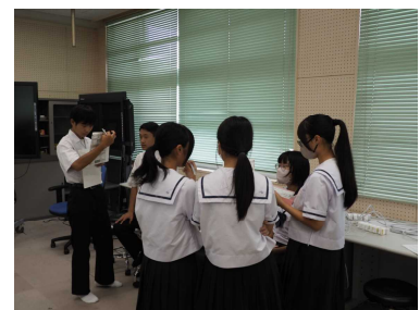
〈執行部の話し合いの様子〉

7月末に、参加希望者を募ったところ、100名を超える生徒が希望してくれました。集合したときには、一人一人の目が輝いており、やる気を感じました。特に三年生の希望者が多く、新たなことに『挑戦』する意欲を感じ、頼もしく思いました。詳細については次号でお知らせします。