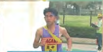
6区 (3年) 練習では常に先頭を走り、みんなを引っ張ってくれました。