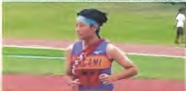
2区 (3年) チーム一の実力者です。見事な快走でした。