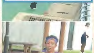
2区 (3年) サッカーの実力者は、ランニングセンスも抜群の走りでした。