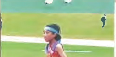
4区 (1年) コツコツと努力を重ね、4区を勝ち取りました。