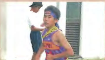
5区 (3年) 根性の人です。気迫の走りで5区を勝ち取りました。