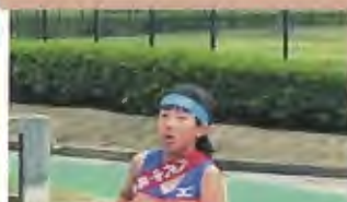
5区 (1年) 水泳のトップスイマーは、陸上でも大活躍でした。