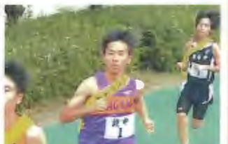
1区 (3年) チーム一の実力者として、立派に責任を果たしました。