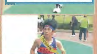
4区 (1年) 上級生を脅かす堂々とした走り、チームに貢献しました。