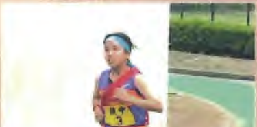
3区 (2年) 大きな力強いフォームで順位を更に押し上げました。