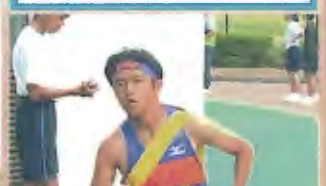
3区 (3年) 練習では誰よりも長い距離を走り、着実に力をつけました。