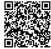
新入生説明会動画 (生徒指導部より)