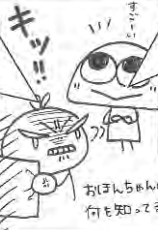
おほんちゃんの何も知ってるのよ!!