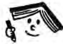
おほんちゃん (本の妖精)