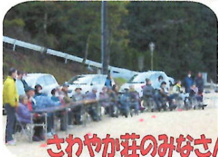
さわやか荘のみなさん