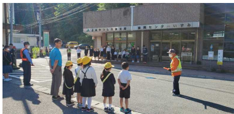
全校児童生徒によるあいさつ運動