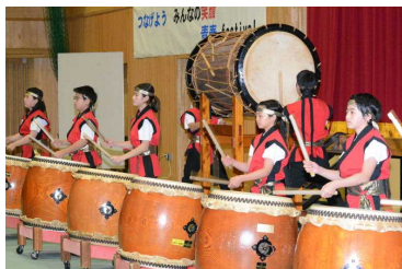
昨年度文化祭の様子