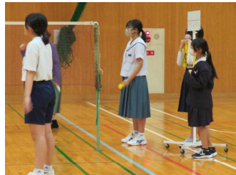
小中合同ミニバレエ大会