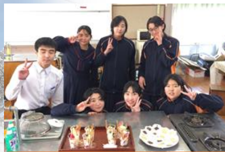
中学校での初めての調理実習でした

これから、自分の夢実現に向けて、新しい世界に一步踏み出すこととなります。新しい世界は、魅力的だけど少し不安もあるかもしれません。そんなときは、一緒に過ごした仲間や先生達を頼ってください。きっとあなたを支える大きな力になってくれます。これからの皆さんの輝かしい未来を信じて、精一杯の応援を送り続けます。